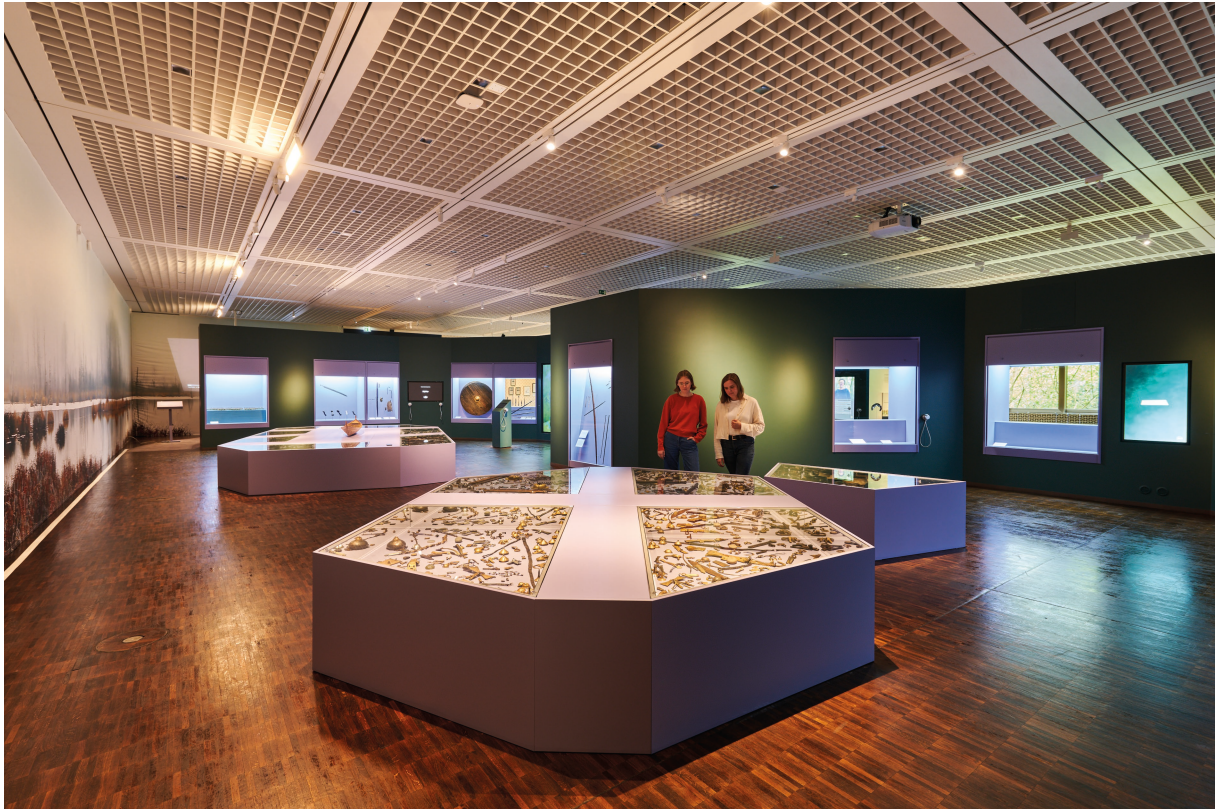
Abb. 4 Der Hauptraum der Ausstellung mit den Mooropferfunden aus Nydam (hinten) und Thorsberg (vorne).

Ausschnitt des Fundmaterials hier tatsächlich zu sehen ist. Doch Vollständigkeit ist nicht das Ziel der Ausstellung und wäre vermutlich auch logistisch in dem mittelgrossen Ausstellungsgebäude nicht zielführend zu bewältigen gewesen. Dafür sind einige der Prunkstücke, etwa die Thorsberger Maske, die Tunika und Hose, oder die Zierscheiben, in eigenen Vitrinen in der Ausstellung kontextualisiert. Allesamt sind die Funde gut ausgeleuchtet.