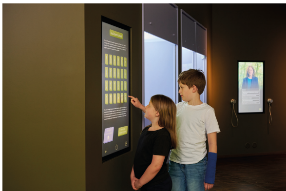
Abb. 2 Kinder setzen sich mit Runen auseinander, dahinter die Audiostation mit Inputs von Suzana Matešić.

Als weitere Aspekte werden zum Beispiel in dem ersten Teil des Rundgangs thematisiert: lateinische sowie sichtbar und unsichtbar getragene Runeninschriften auf Objekten (Abb. 2)